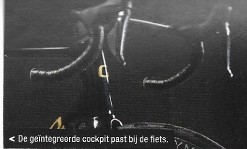
< De geïntegreerde cockpit past bij de fiets.

Ook over de nieuwe Shimano Ultegra Di2 elektronische groepset hoor je trouwens niemand in het testpanel klagen. Die schakelt feilloos, heeft shifters die lekker in de hand liggen en is er nu in 12-speed. De stapjes tussen de tandwielen van de 11-30 cassette zijn dus kleiner