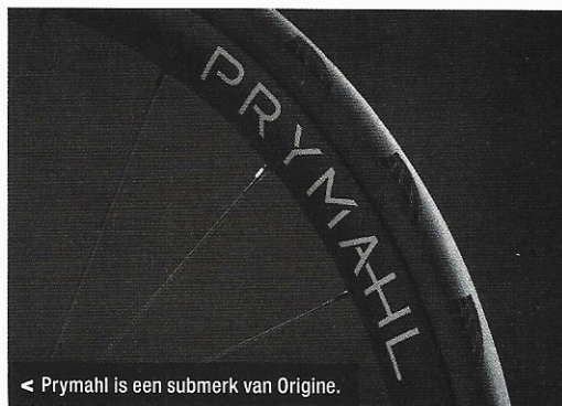
< Prymahl is een submerk van Origine.