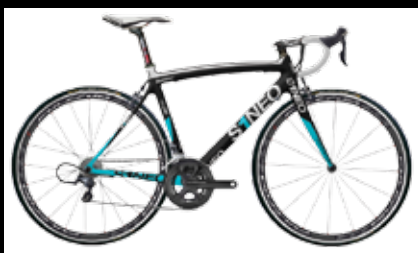
SINEO 399 ULTEGRA 2499€