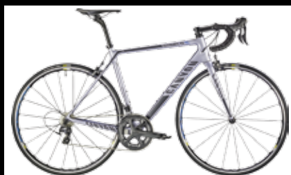
CANYON ULTIMATE CF SL 9.0 2199€