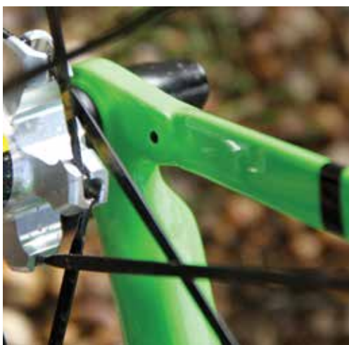
La jonction haubans/bases s'effectue par des vis collées. Aucun intérêt technique mais une facilité d'assemblage permettant de réduire le prix du vélo.