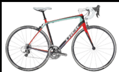
TREK MADONE 4 PROJECT ONE 3349€