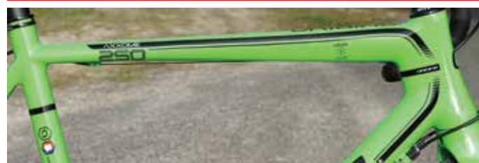
Top tube pyramidal sans toutefois casser la ligne simple du vélo. Hormis un vaste choix de couleurs, on peut choisir comme ici l'option liserés.