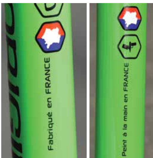
D'un côté comme de l'autre, sur le tube de selle, on ne renie pas ses origines.