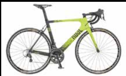
ROSE XEON CW-3000 2342€