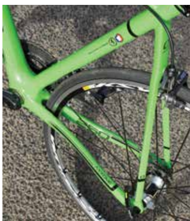
Haubans de section triangulaire, wishbone, bases cintrées, les formes sont travaillées mais pas à l'excès. De la rigidité mais du confort aussi. Boîte de pédalier BB30 montée ici avec un adaptateur PressFit 30/24.